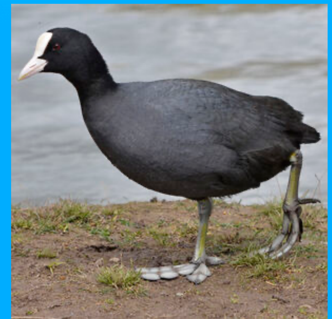
La foulque macroule

La réserve accueille les neuf espèces de hérons présentes en Europe, des aigrettes, des ibis, des foulques macroules, mais aussi des ragondins et des reptiles (notamment la cistude d'Europe).