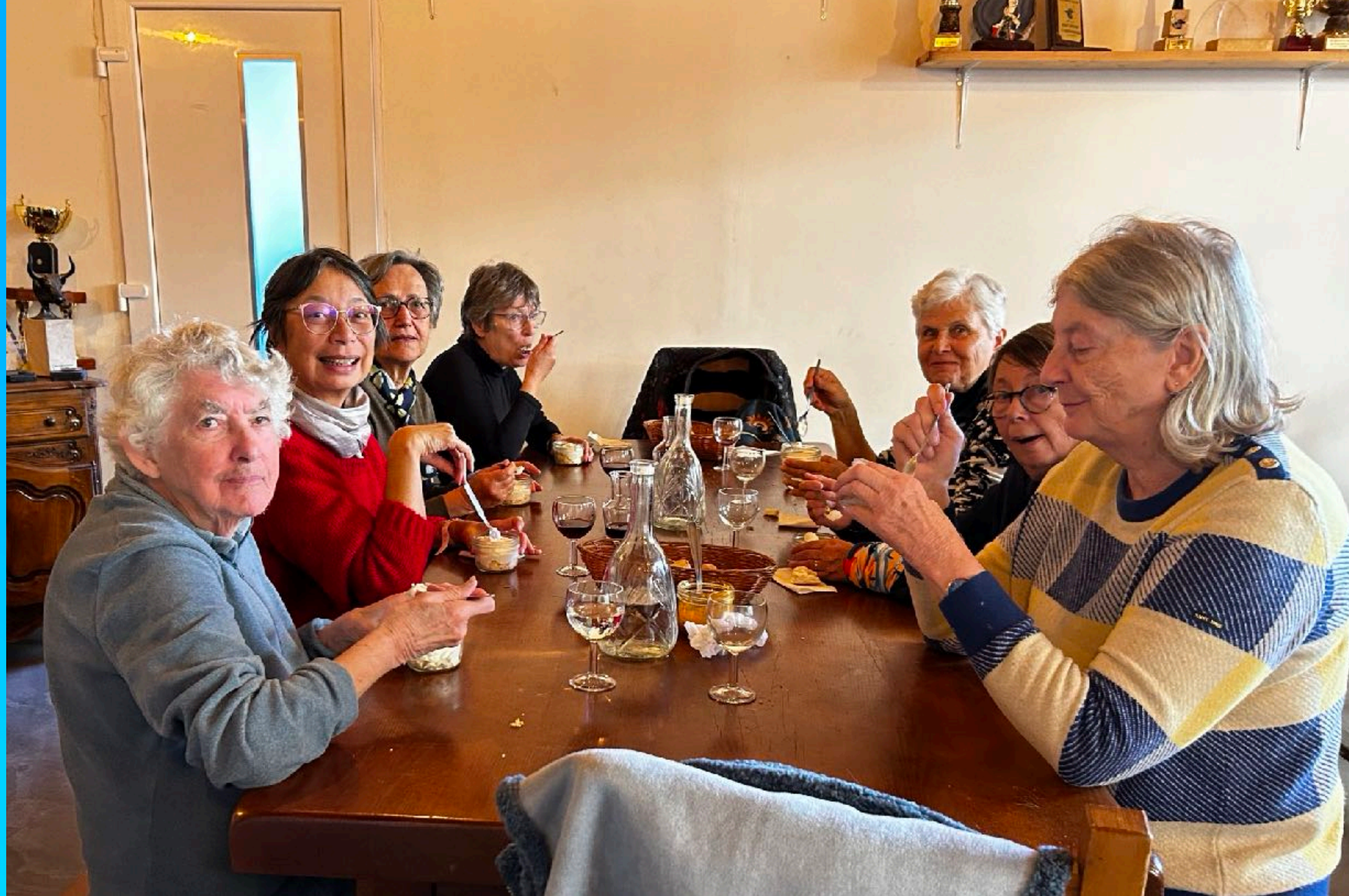
Pause conviviale au restaurant Le Chat