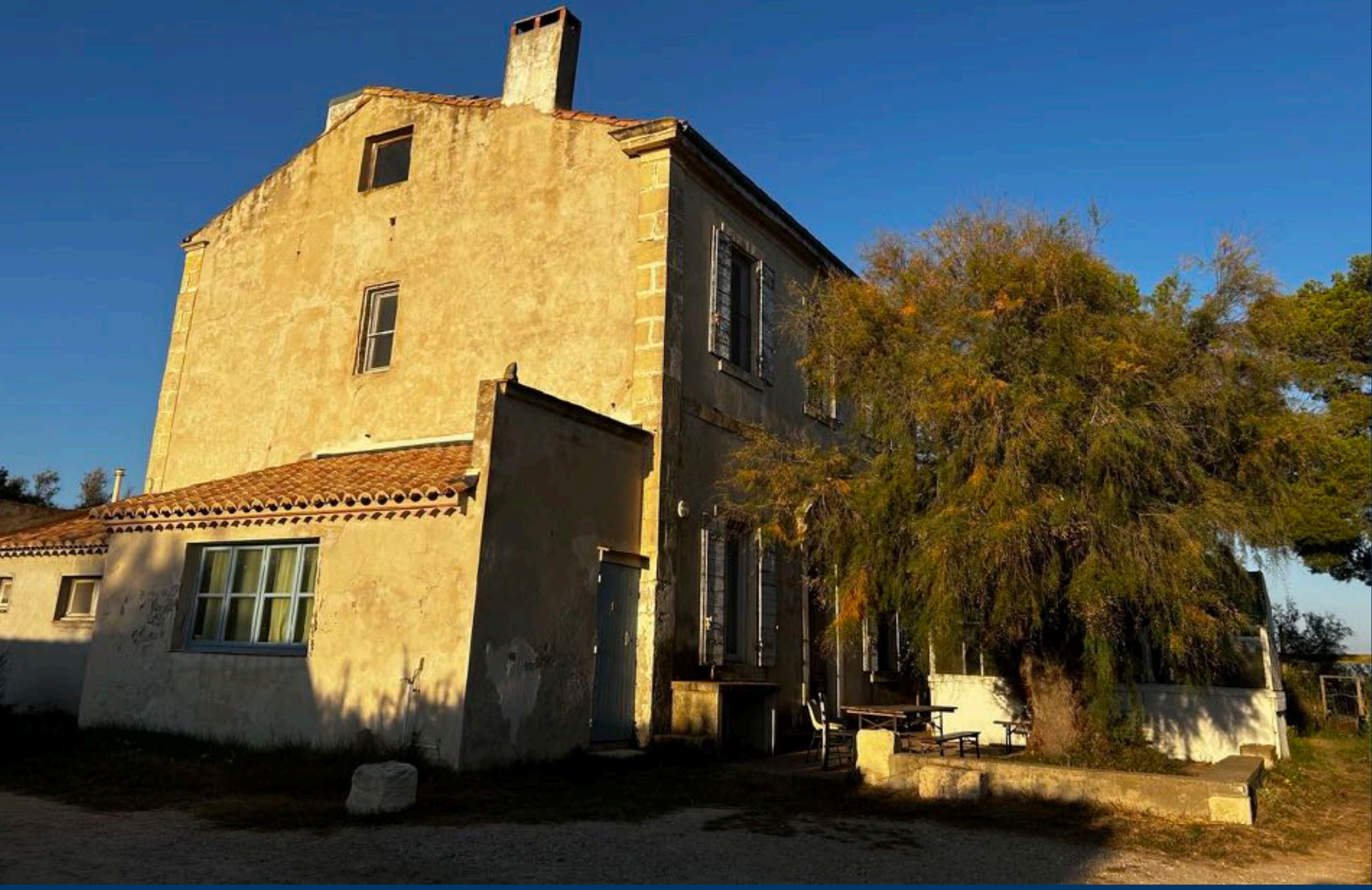
Le gîte de Salin de Badon