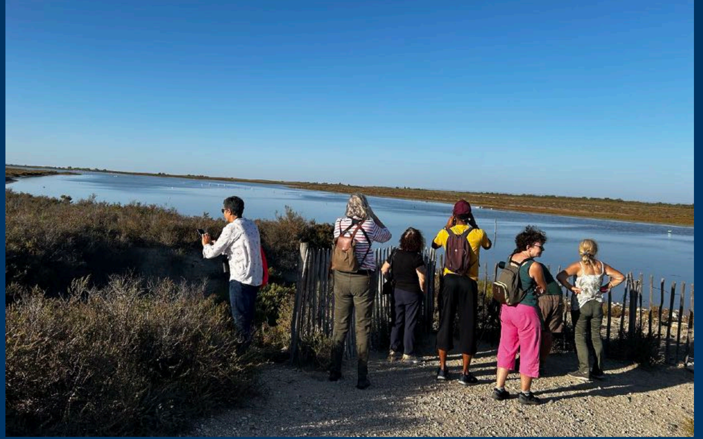
Une fois encore regarder les oiseaux